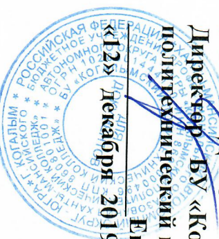
График проведения профессиональных проб для учащихся 9-х классов общеобразовательных организаций города Когалыма в 2019-2020 учебном году в БУ «Когалымский политехнический колледж»