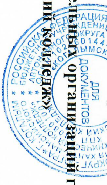
График проведения профессиональных проб для учащихся 9-х классов общеобразовательных учреждений города Когалыма в 2019-2020 учебном году в БУ «Когалымский политехнический колледж» в период с 18 по 23 ноября 2019г.