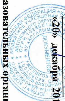
График проведения профессиональных проб для учащихся 9-х классов общеобразовательных организаций города Когалыма в 2019-2020 учебном году в БУ «Когалымский политехнический колледж»

в период с 23 декабря по 27 декабря 2019г.