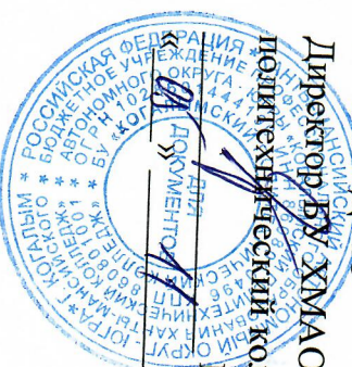
График проведения профессиональных проб для учащихся 9-х классов общеобразовательных организаций города Когалыма в 2019-2020 учебном году в БУ «Когалымский политехнический колледж» в период с 5 по 9 ноября 2019г.